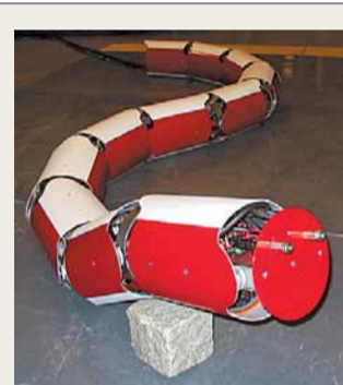
Funktion Die Roboterschlange Anna Konda funktioniert ähnlich wie der Greifer eines Baggers. Die einzelnen Gelenke werden vom Computer gesteuert.

„Das Interessante an dem Konzept ist, dass der Roboter seine Energie für die Bewegung aus dem Löschwasser bezieht, das bereits im Schlauch vorhanden ist“, sagt Hubertus Murrenhoff, Leiter des Instituts für fluidtechnische Antriebe und Steuerungen der RWTH Aachen. „In diesem System kann die Hydraulik all ihre Vorteile ausspielen: Die Antriebe sind platzsparend und können sehr schnell sehr große Kräfte erzeugen.“ Tatsächlich sind die Fähigkeiten des Schlangenroboters beeindruckend: Der Betriebsdruck von 100 Bar erzeugt Kräfte, mit denen bis zu 300 Kilogramm schwere Felsbrocken zur Seite geräumt werden können, sagt Liljebäck. „Theoretisch kann Anna Konda sogar Wände durchbrechen.“