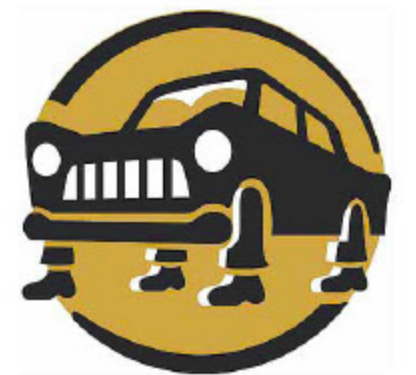
Sind eher störend: Strafpunkte