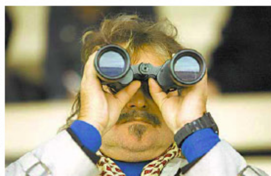
Hält gut fern: Schiffschutz