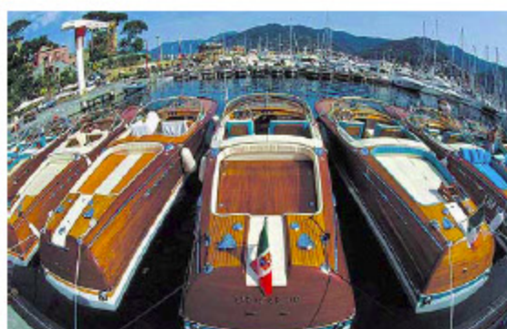
Machen viel her: Holzboote