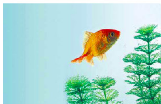
Sieht cool aus: Aquarium