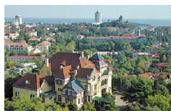
Kommt deutsch daher: Qingdao